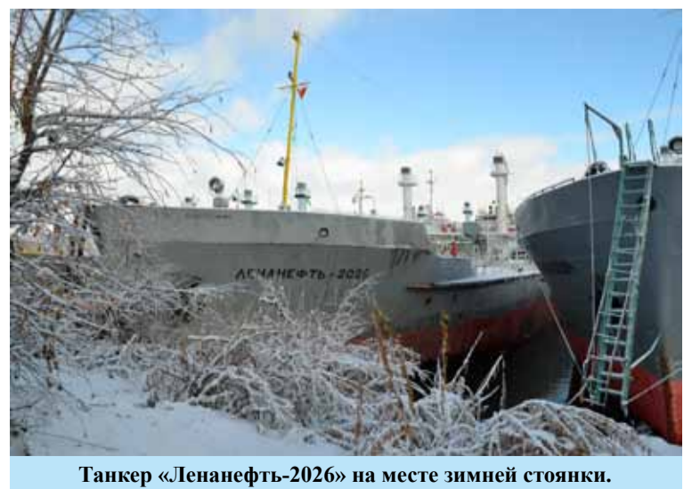
Танкер «Ленанефть-2026» на месте зимней стоянки.