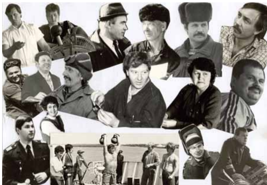
Материалы подготовила Нина ОЛЕНИЧЕНКО.

Сегодня мы от души поздравляем тех, кто начал с нуля Иртышскую РЭБ флота, кто стоял у истоков предприятия, кто, несмотря ни на что, преодолел все трудности становления и бытовой неустроенности, кто создавал богатую историю и принес большие трудовые победы своему предприятию и Иртышскому пароходству в целом.