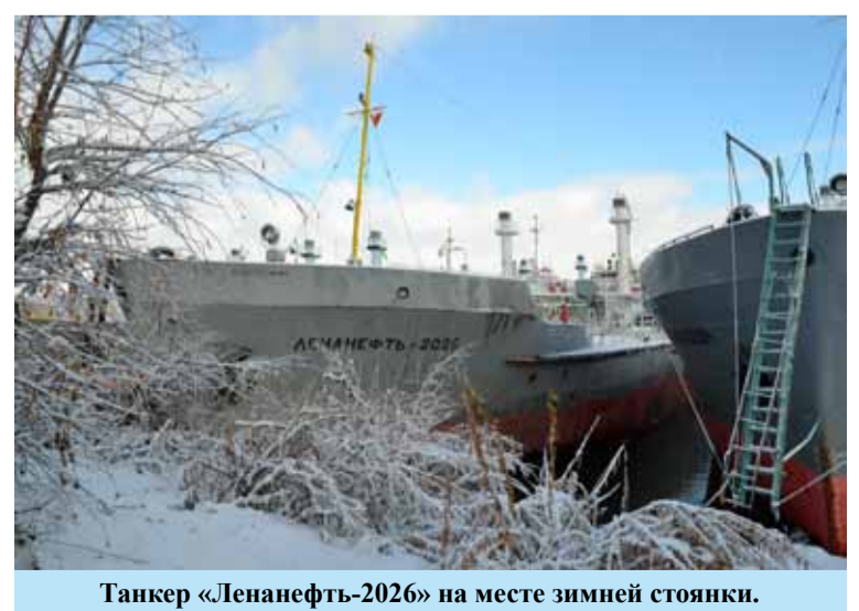
Танкер «Ленанефть-2026» на месте зимней стоянки.