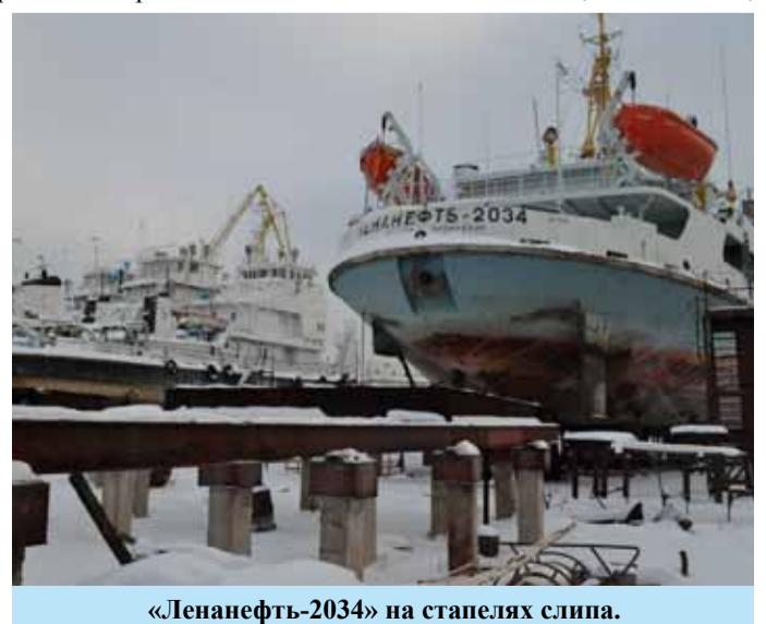
«Ленанефть-2034» на стапелях слипа.