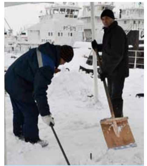
Экипаж очищает палубу от снега.