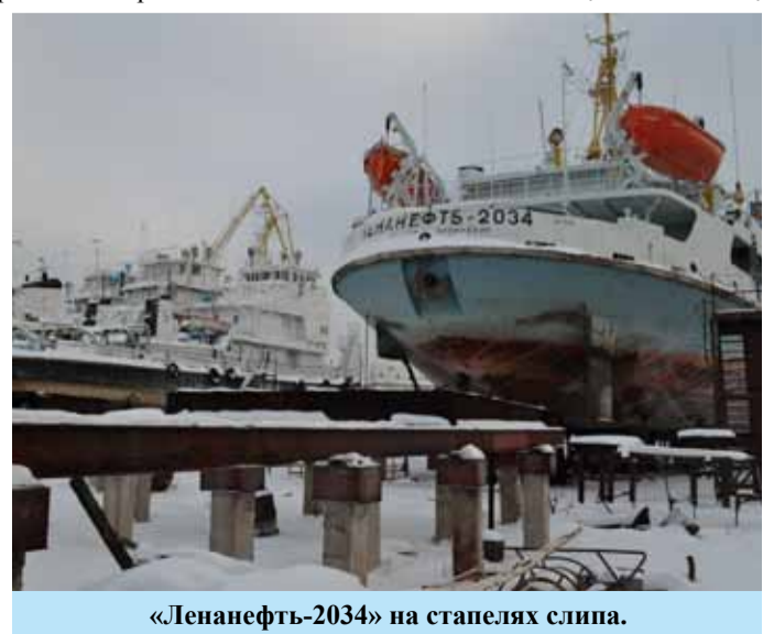
«Ленанефть-2034» на стапелях слипа.